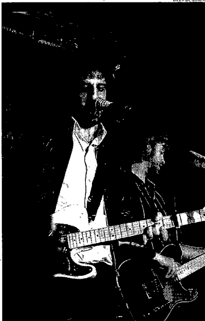
DIARI DE GIRONA