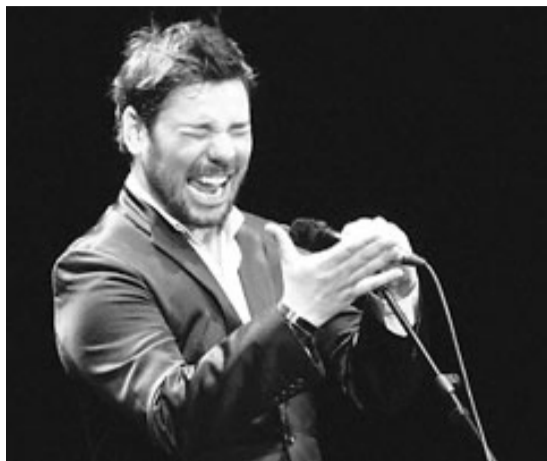
Miguel Poveda, divendres a Girona.