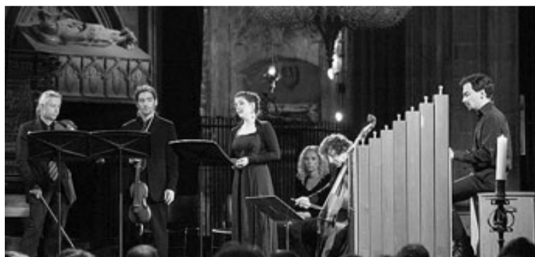
Un moment del concert de dissabte a la catedral de Girona. / LLUÍS SERRAT

Philippe Pierlot i el Ricercar Consort van acariciar aquesta obra amb absoluta transparència de les textures vocals i allunyant-se d'efectes que poguessin enterbolir el sentit de