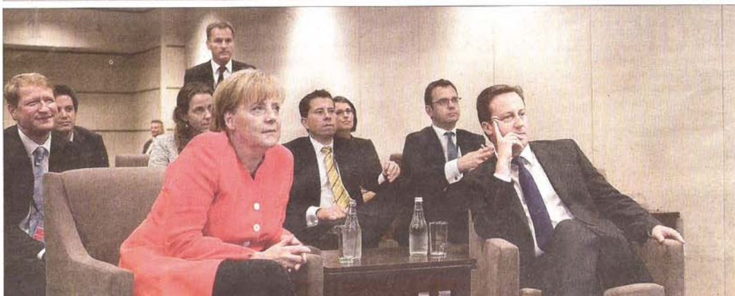
Merkel i Cameron van aprofitar un descans a les reunions del G-20 per veure el partit Alemanya-Anglaterra

Argentina i Alemanya, a quarts però amb polèmica