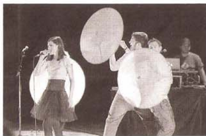
Delafé y las Flores Azules. / NÚRIA GARRO