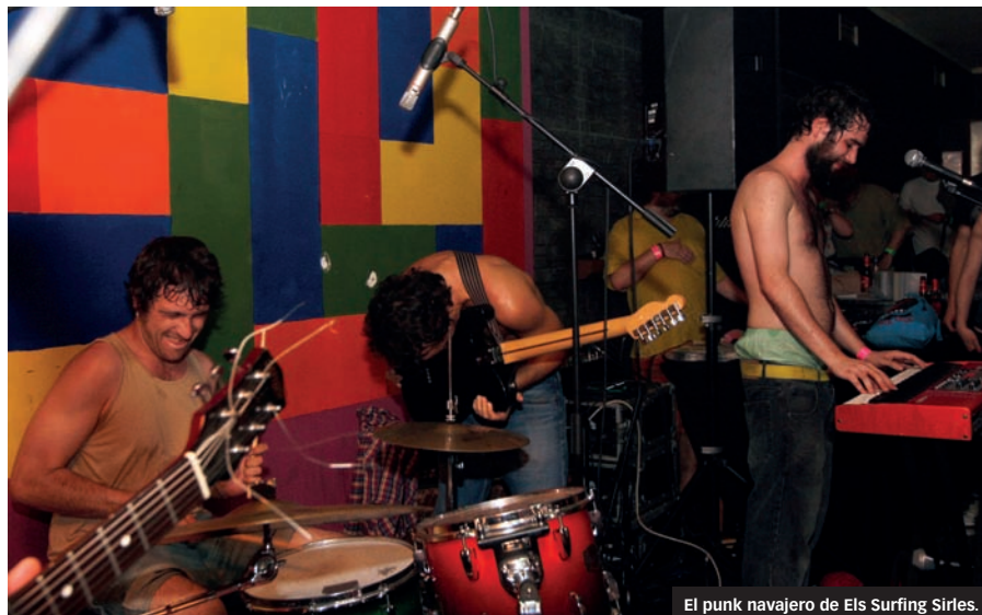
El punk navajero de Els Surfing Sirlés.

El buen rollo de DELAFÉ Y LAS FLORES AZULES es puro mainstream , del mismo modo que DORIAN suenan a una mala copia de Alaska y al punk-funk de MENDEZ pareció haberse pasado el arroz. En el apartado rock'n'roll, MUJERES evidenciaron muy buenas ma-